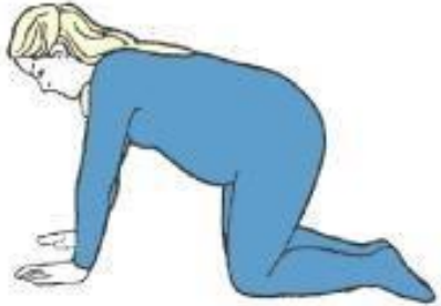
Hands and knees