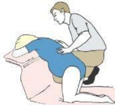
Kneeling and leaning forward with support