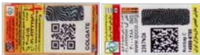
برچسب تقلبی و نا معتبر