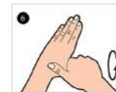
شست دست چپ را به صورت چرخشی توسط کف دست راست بمالید، این عمل با دست دیگر نیز انجام شود.