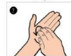
پشت و کف انگشتان دست راست را به صورت چرخشی در کف دست چپ بمالید. این عمل با دست دیگر نیز انجام شود.