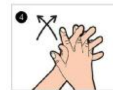
کف دست ها و بین انگشت ها را به هم بمالید