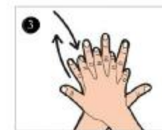
کف دست راست را به پشت دست چپ و لای انگشتان بمالید، این عمل با دست دیگر نیز انجام شد