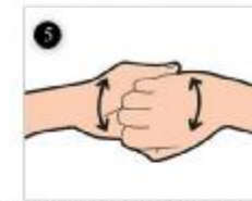
پشت انگشتان را به حالت خم شده به کف دست دیگر بمالید.